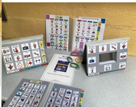
Startpakke - alternativ betjening