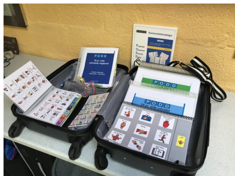
Startpakke - direkte udpegning

Herved kan man få et bedre beslutningsgrundlag, inden man går i gang med at individualisere og fremstille en hel bog til en bestemt bruger.